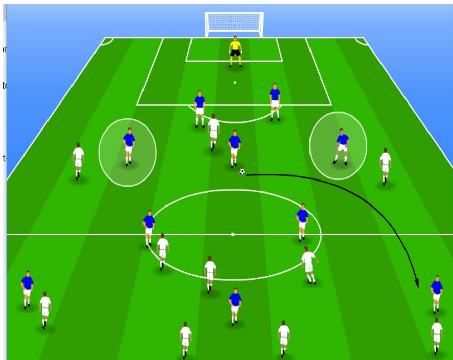
1v1 sur le côté

Ainsi, même face à des adversaires proches dans leur moitié de terrain, City pourrait garder ses joueurs offensifs dans le dernier tiers du terrain sans qu'ils aient à s'inquiéter trop de la défense de l'espace derrière eux, ce dernier étant déjà couvert précisément par les deux anciens défenseurs latéraux maintenant placés milieu de terrain.