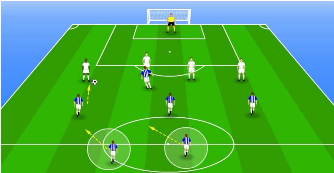
Les avantages dans le contre pressing

L'équipe en possession peut laisser le milieu axial et le latéral opposé en position centrale par exemple, à la protection des deux défenseurs centraux, en créant supériorité numérique vis-à-vis des attaquants adverses, restant sur la ligne de la balle éventuellement pour relancer le contre-pied collectif.